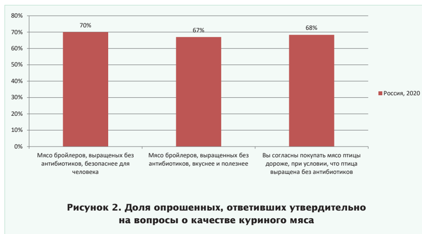
Рисунок 2. Доля опрошенных, ответивших утвердительно на вопросы о качестве куриного мяса